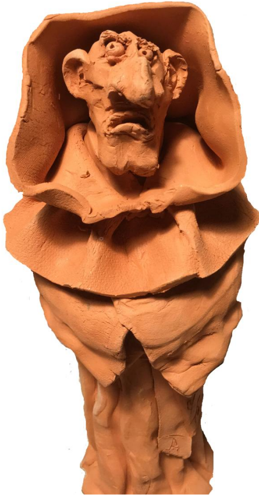
De geboetseerde geestelijke uit Praag

Karl Barth het in zijn magistrale in 1918 in Tambach uitgesproken rede ' Der Christ in der Gesellschaft ' 5 ooit zo prachtig formuleerde?